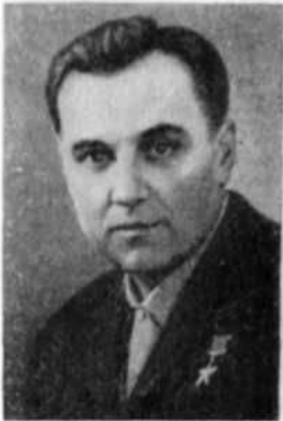
В. О. Сухомлинський.

“Суспільна сутність людини виявляється у її відношеннях, зв'язках, взаємовідносинах з іншими людьми. Пізнаючи світ і себе як частину світу, вступаючи в різноманітні відносини з людьми, відносини, що задовольняють її матеріальні і духовні потреби, дитина включається в суспільство, стає його членом. Цей процес приєднання особистості до суспільства і, отже, процес формування особистості, вчені називають соціалізацією ”